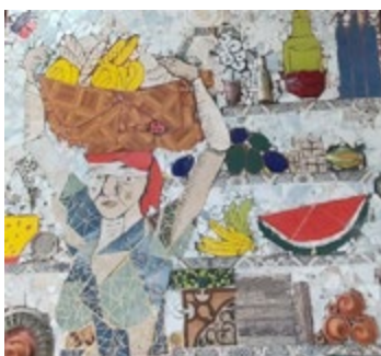
Mural La Pasera (detalle).

del proyecto. La definición de metas a largo y corto plazo y la eficiencia en el aprovechamiento de los recursos y el estilo de gestión es consensuada. Sin profundizar en las implicancias del contexto de pandemia y las restricciones, es una cuestión a destacar las estrategias de trabajo: las instancias de selección y unificación de criterios, la distribución de tareas, las puestas en común y la comunicación asertiva han sido la clave del fructífero trabajo interinstitucional. (Periodismo misionero, 2021)