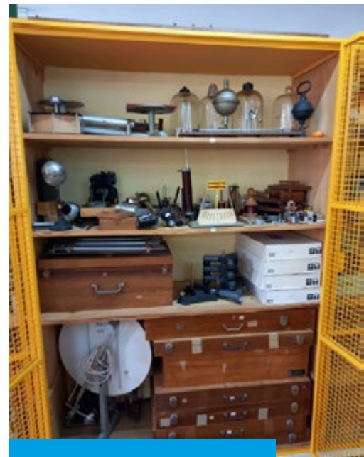
Reubicación de materiales

contaba con un código alfanumérico, por ejemplo 6 M 001 B1 en donde el 6 corresponde a la carpeta en el archivo del Inventario; M el capítulo de física, en este caso Magnetismo. Los tres dígitos (001) corresponden al orden dentro de la lista de Magnetismo. La letra B indica la puerta del armario donde está guardado, y el número 1 el estante, comenzando siempre por el superior. El código es útil para ubicarnos al buscar en una lista, para localizar en el laboratorio y para devolver al lugar en donde se encuentra. Pero si no se sabe el código y solamente se sabe el nombre del aparato que se necesita, por ejemplo, «Bobina», se puede localizar en la lista de nombres ordenado alfabéticamente, o mediante la función buscar «Control + B», + «Bobina» + Enter y en pantalla se tendrán las distintas Bobinas con que cuenta el Laboratorio y, siguiendo con el mismo criterio, se puede llegar a la bobina en cuestión. A partir de allí, se puede organizar el trabajo práctico o la experiencia conociendo el estado en que dicha bobina se encuentra o si la fuente de tensión necesaria se encuentra o no en funcionamiento.