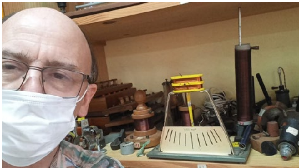
Equipos de electricidad y electromagnetismo