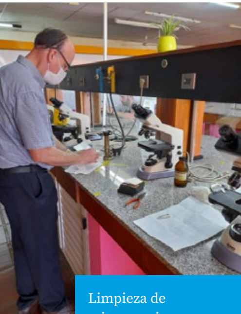
Limpieza de microscopios