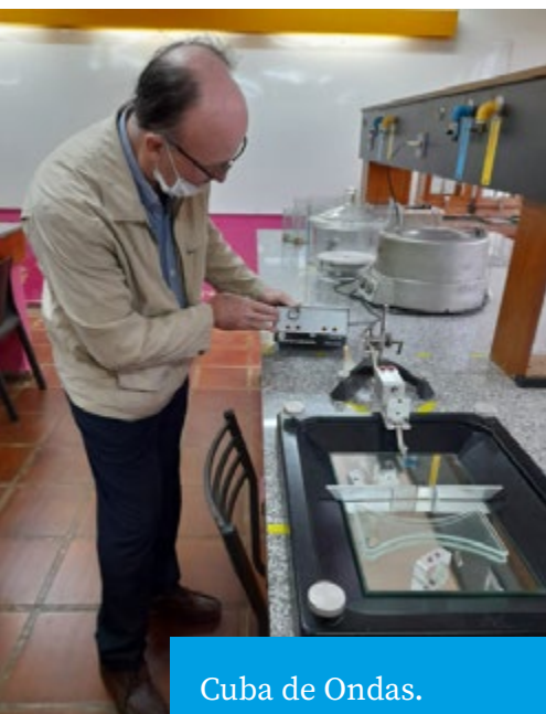
Cuba de Ondas. Disposición de todos los componentes de la cuba de ondas

toridades del instituto me permitieran acceder al Laboratorio de Física.