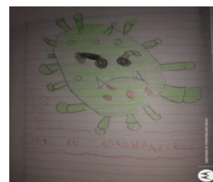
Según mi sobrino nieto Benjamín (6 años)